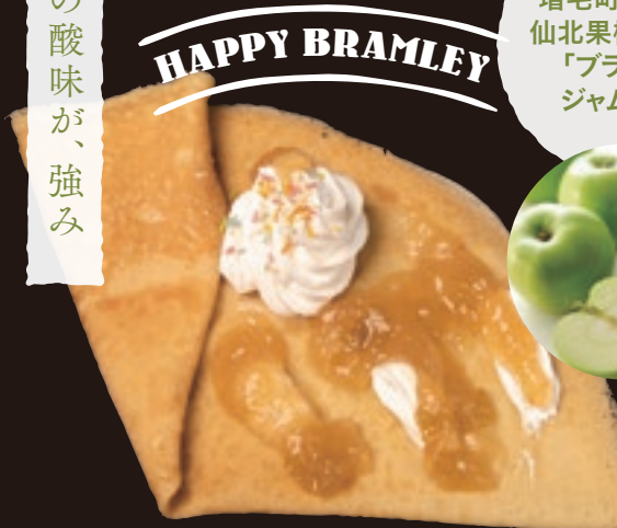
ハッピーブラムリー 強い酸味を持つこのりんごは、ジャムになった途端に深い風味と味わいの濃厚なジャムに変身します。 ¥530