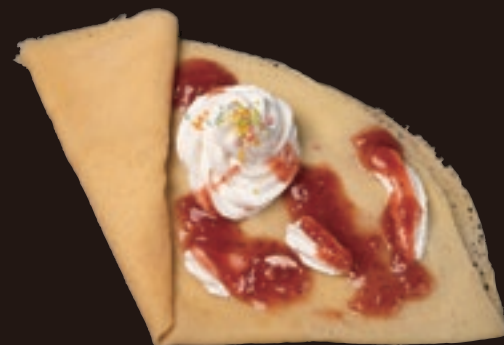
いちごジャムクレープ ¥530

チョコ/キャラメル/コーヒークレープ 各 ¥350 クリームのみクレープ ¥300