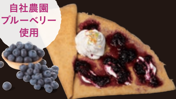
ブルーベリージャムクレープ ¥500