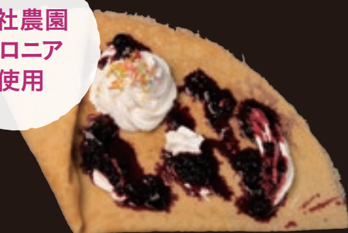
アロニアジャムクレープ ¥500