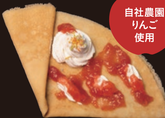
りんごジャムクレープ ¥500