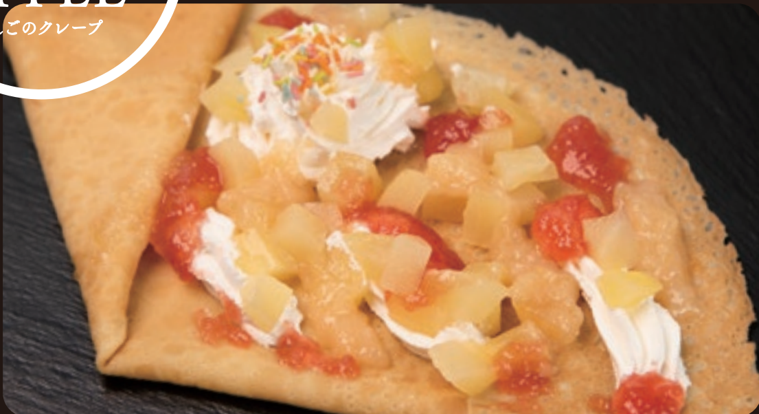
アップルヴィレτζジクレープ ¥880