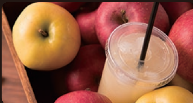
イルムの丘のりんご園の りんごジュース ¥350