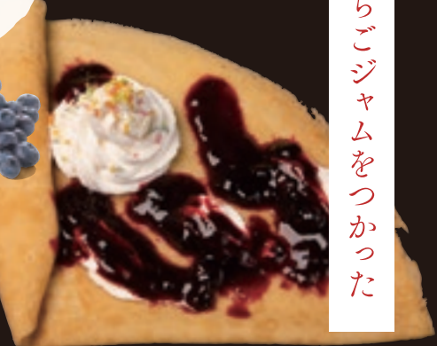
ミックスベリージャムクレープ いちごジャムと藤谷果樹園で採れたブルーベリーで作ったジャムをミックスした贅沢な味わいのクレープ ¥530