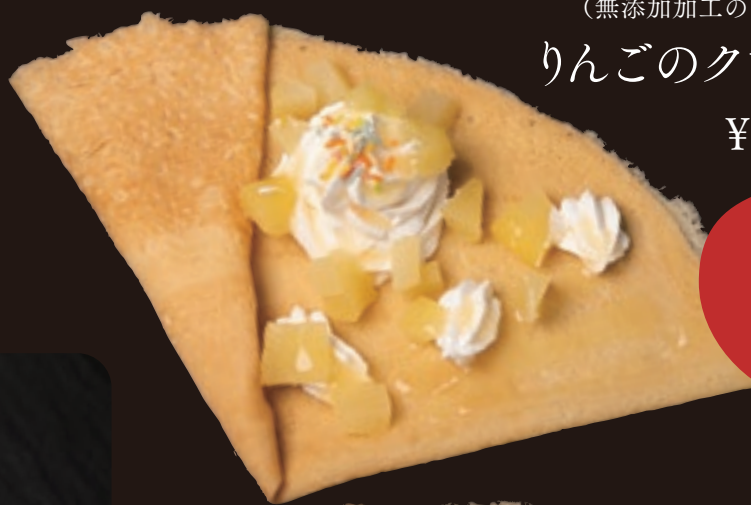
りんごバタークレープ ¥530